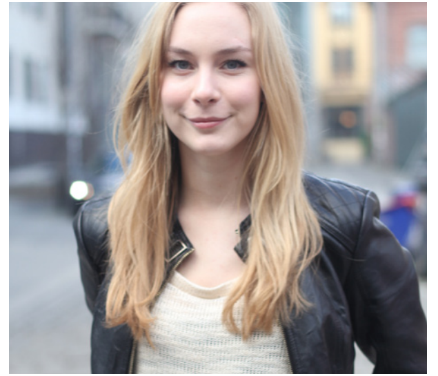
Faglig ansvarlig: Linn-Elise Øhn Mehlen.

Mandag 15. juli til fredag 20. juli skjer det på Gulsrud leirsted i Buskerud. Leiren koster 975,- og er åpen for alle medlemmer i RU og alle som er interesserte. Meld deg på her: rødungdom.no/sommerleir