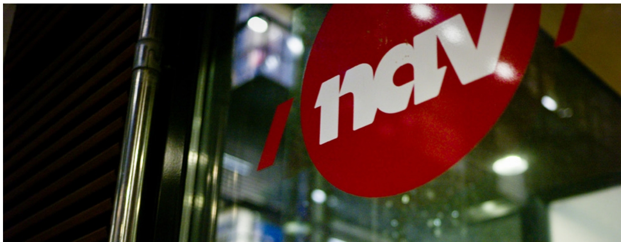
Arbeidsavklaringspenger: Mange kan havne på sosialstønad.

– Intensivering av krigshandlinger gir til økte lidelser for sivilbefolkninga. Bekjempelse av jihadistene lykkes sjelden ved militær opptrapping. Erfaringene fra krigens første fase, i Libya, tilsier at Norge ikke bør delta i en kommende krig om Afrika, avslutter Moxnes.