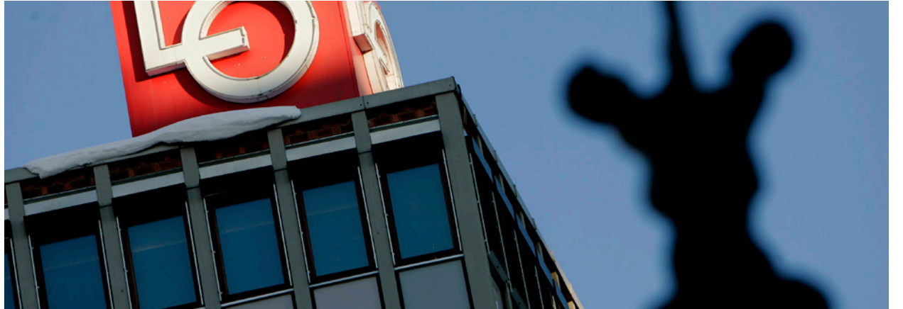
Støtter Rødt: LO-kongressen bevilga 200.000 til Rødts valgkamp.