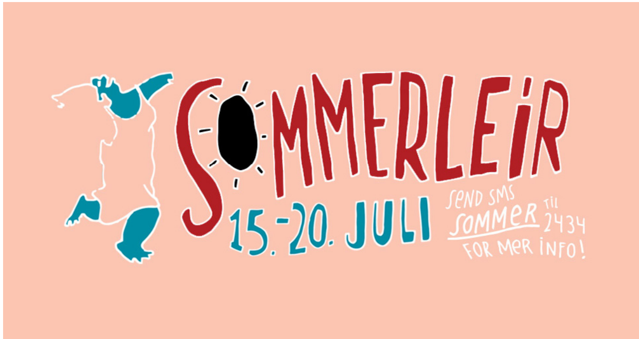
Sommerleir: Sommerens vakreste eventyr. Illustrasjon: Helene Brox.