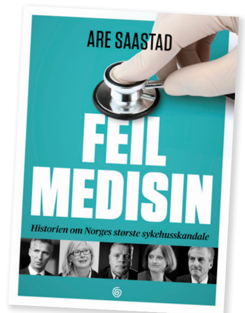
Ute nå: Feil medisin .

– Boka mi kan forhåpentlig bidra til den