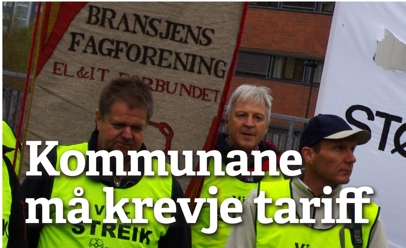
Tariffstreik: Streiken i Atea vart avslutta med tvungen lønnsnemnd.

Utgiver: Rødt Osterhaus' gate 27 0183 Oslo