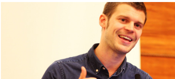
Rødt-leder: Bjørnar Moxnes.